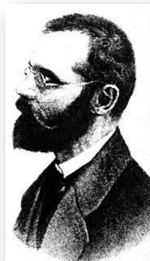
Ο Τζ. Ρότσι

Αρχικά, το 1878 δημοσιεύει με το ψευδώνυμο «Cardias» ένα διήγημα με τίτλο « Un Comune Socialista » (Μια Σοσιαλιστική Κοινότητα) με σκοπό να διαδώσει τις ιδέες του σε ένα ευρύτερο κοινό. Το βιβλίο αυτό θα προκαλέσει έντονο ενδιαφέρον, θα γνωρίσει πολλαπλές εκδόσεις και θα τον καταστήσει ευρύτερα γνωστό. Στο διήγημα αυτό, που βασική του ηρωίδα είναι μια κοπέλα ονόματι Cecilia, ο Ρότσι περιγράφει τη ζωή και τον τρόπο οργάνωσης μιας φανταστικής σοσιαλιστικής αγροτικής κοινότητας, χωρίς καμιά απολύτως ιεραρχία και στην οποία η ιδιοκτησία των μέσων παραγωγής είναι συλλογική. Στο συγκεκριμένο διήγημα ο συγγραφέας ασκεί έντονη κριτική στη θρησκεία, την ιδιωτική ιδιοκτησία και την πατριαρχική πυρηνική οικογένεια ενώ ταυτόχρονα παρουσιάζει με σαφή και άμεσο τρόπο τους βασικούς άξονες της σκέψης του: την αναρχία, την χειραφέτηση των γυναικών, τον ελεύθερο έρωτα, τη συλλογική ιδιοκτησία των μέσων παραγωγής και την αθεΐα.