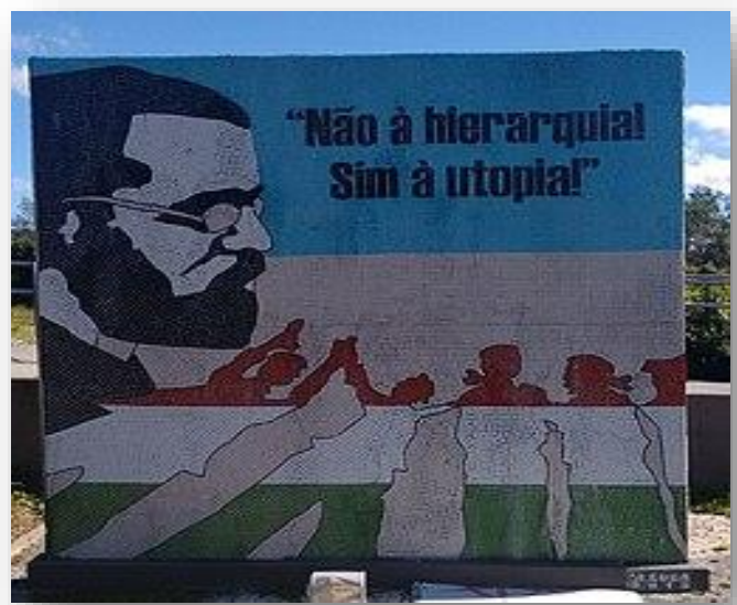
Ψηφιδωτό στον χώρο/μνημείο της αποικίας Cecilia

«το αναρχικό ιδεώδες είναι ανοιχτό σε όλες τις ιδέες, όλες τις τάσεις, όλες τις πρωτοβουλίες».