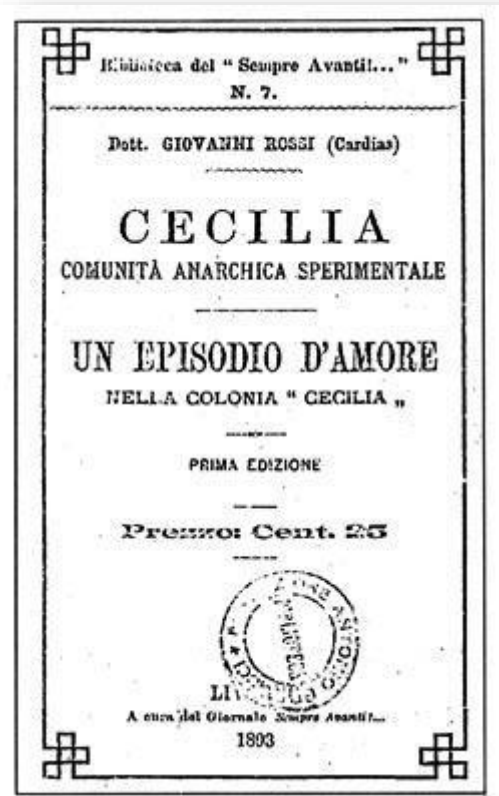
“Ένα ερωτικό επεισόδιο στην αποικία Cecilia”

Οι λόγοι για τους οποίους τερματίστηκε το πείραμα της Cecilia ήταν πολλοί και διαφορετικοί. Πρώτα απ' όλα ήταν η υλική σπάνη που τη χαρακτήριζε με αποτέλεσμα την ύπαρξη ενός κλίματος μιζέριας και απογοήτευσης. Δεύτερον, η εχθρότητα μιας γειτονικής κοινότητας Πολωνών μεταναστών, η οποία ήταν έντονα καθολική σε συνδυασμό με την στενή επιτήρηση του κράτους. Όλοι αυτοί για τους δικούς τους λόγους δεν έβλεπαν με καθόλου καλό μάτι τις ιδέες που πρέσβευαν οι κάτοικοι της Cecilia, περί αθεϊσμού, ελεύθερου έρωτα, αντικρατισμού, και ιδίως την προσπάθειά τους να διαδώσουν αυτές τις ιδέες και εκτός των ορίων της κοινότητας παίρνοντας εν τέλει μέτρα με στόχο τον εξωστρακισμό των αναρχικών αποίκων. Τέλος, οι ασθένειες που προκαλούνταν από την αδυναμία εφαρμογής των αναγκαίων συνθηκών υγιεινής και την έλλειψη υγιεινής διατροφής, καθώς και, σίγουρα, τα διάφορα εσωτερικά προβλήματα που σχετίζονται με τα διαφορετικά επίπεδα πολιτικής συνειδητοποίησης των κατοίκων και κατ' επέκταση την ετοιμότητά τους να εφαρμόσουν στην καθημερινή τους ζωή τους διακυρηγμένους στόχους και ιδανικά της κοινότητας. Χαρακτηριστικό ήταν το παράδειγμα του ελεύθερου έρωτα που, αν και θεωρητικά υποστηρίζονταν από όλους, στην πράξη, προκαλούσε σε πολλούς φόβο ενώ δεν έλλειπαν και περιστατικά ζηλίας.