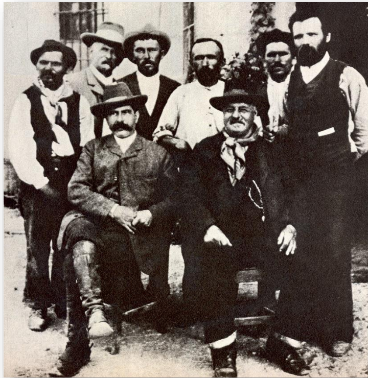
Ο Ρότσι (όρθιος 1ος από δεξιά), ο Τζ. Μόρι και άλλα μέλη της Cittadella

Ένωσης της Cittadella –όπως ήταν το πλήρες όνομα του συνεταιρισμού- ο οποίος αρχικά αποτελούνταν από 20 οικογένειες. Ο Ρότσι ευελπιστούσε ότι ο συγκεκριμένος συνεταιρισμός θα μπορούσε να μετεξελιχθεί σε μια αναρχοκομμουνιστική αγροτική κοινότητα. Ωστόσο, η πραγματικότητα θα τον διαψεύσει. Παρόλο που σε παραγωγικό επίπεδο ο συνεταιρισμός αποδείχθηκε αρκετά επιτυχημένος, τόσο ώστε να κερδίσει το ασημένιο μετάλλιο για την ποιότητα και την ποσότητα των γεωργικών προϊόντων που παρήγαγε στην Έκθεση του Παρισιού το 1889, ο Ρότσι δεν έμεινε ικανοποιημένος από το πείραμα. Αν και πραγματοποιήθηκε μια εκτεταμένη κολλεκτιβοποίηση σε πλαίσια αυτοδιαχείρισης, οι κοινωνικές σχέσεις στην καθημερινή ζωή των μελών παρέμειναν σε μεγάλο βαθμό ίδιες με πριν. Οι αγρότες ήταν απρόθυμοι να υιοθετήσουν τις συνειδησιακές αλλαγές που ο ίδιος θεωρούσε απαραίτητες για την επίτευξη του αναρχικού κομμουνισμού. Το 1889, ο Ρότσι θα εγκαταλείψει τελικά απογοητευμένος τον συνεταιρισμό, ο οποίος θα συνεχίσει για ακόμα ένα χρόνο μέχρι την διάλυσή του.